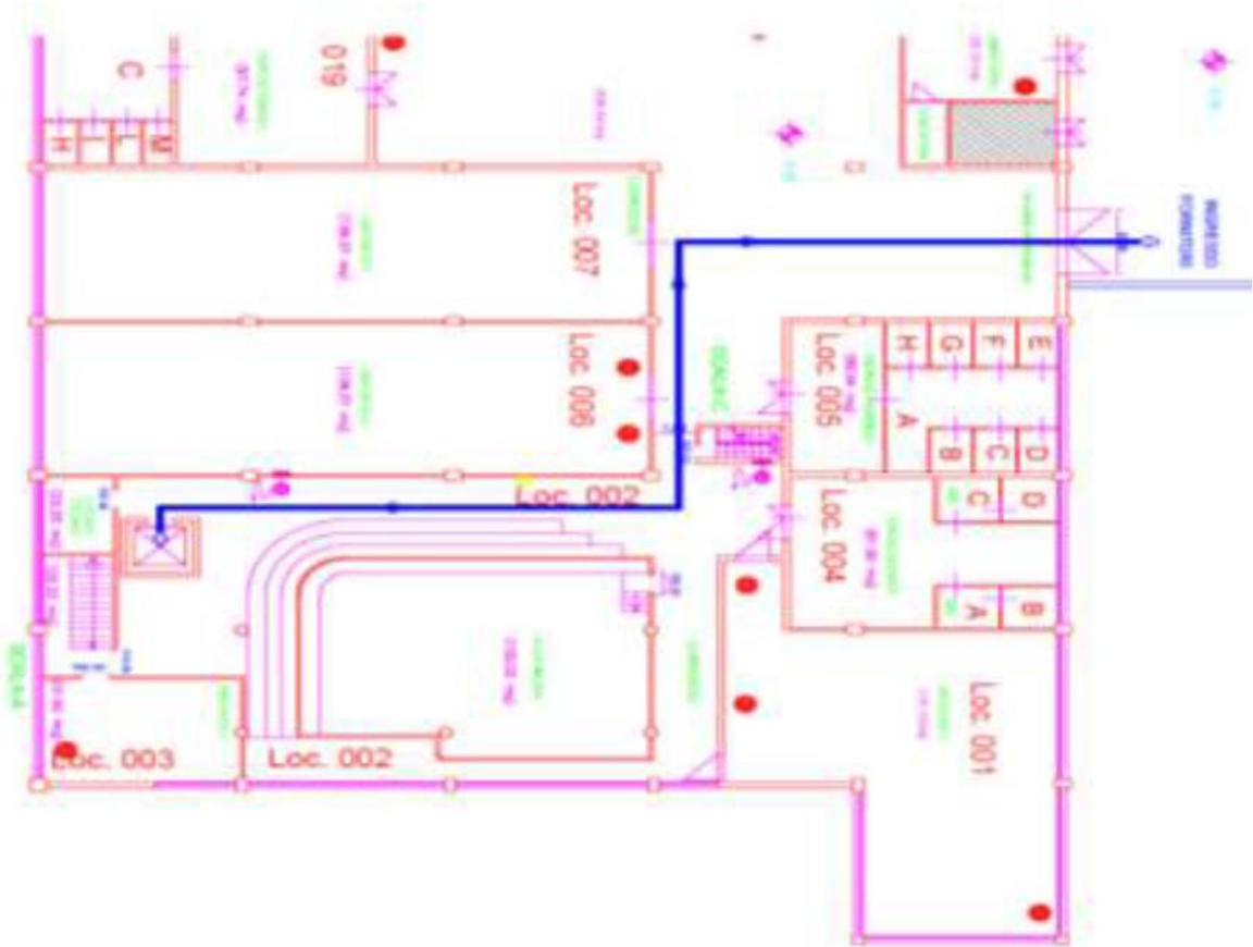
Percorso Piano 2 da ascensore a loc 213